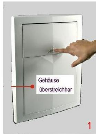
1 Vorderansicht geschlossenes Gerät