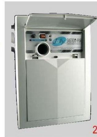
2 Steuerung u. Saugdose